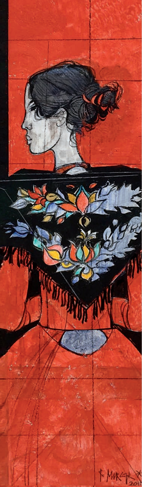
Titel: Festtag, 2015, Mischtechnik Grösse: 12 x 39 cm